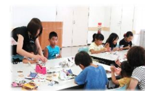
昭和のあそびパーク 実行委員会