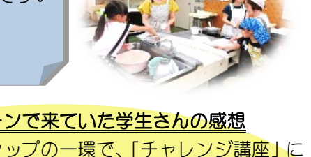
ばんや “なかよしこよし”