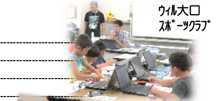
ウィル大口スポーツクラブ